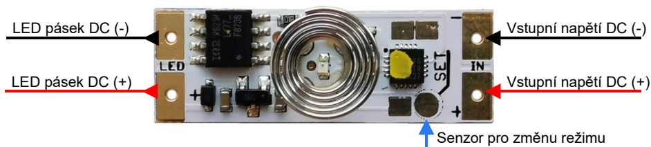
Obr.1 - Zapojení vývodů modulu stmívače