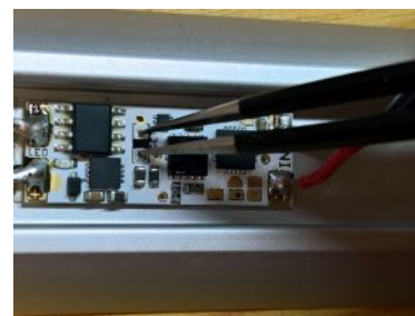
Obr. 2 - Nastavení režimu

Vyrábí a servis zajišťuje: LED4est, s.r.o. Špindlerova 788 Roudnice nad Labem CZ - 413 01 DIČ: CZ28663187